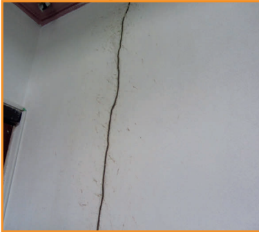
Capela de São Braz