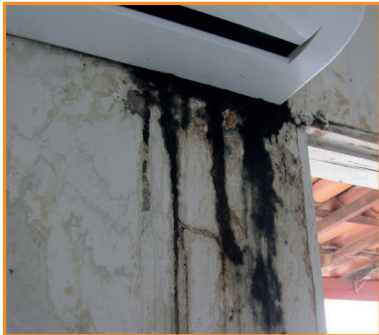
Nossa Senhora de Fátima I