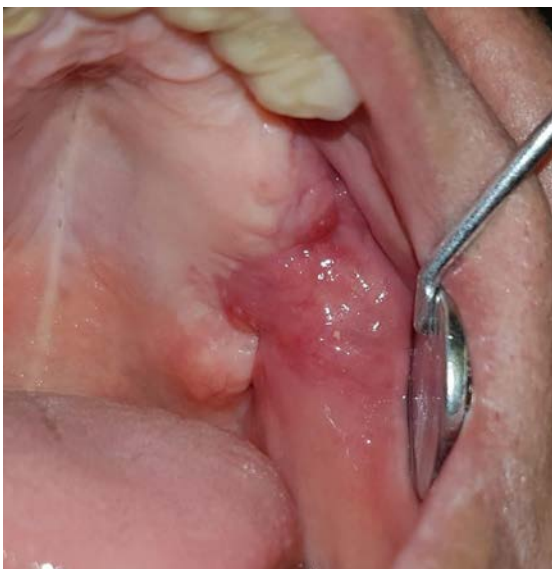
Figura 3 – Aspecto de normalidade da região 15 dias após o procedimento cirúrgico.

No pós-operatório foi prescrito amoxicilina (875mg) associada à clavulanato de potássio (125mg) a cada 8 horas, por 7 dias, dipirona (500mg) a cada 6 horas, por 3 dias e, nimesulida (100mg) a cada 12 horas, por 3 dias. O paciente evoluiu sem qualquer intercorrência e as suturas foram removidas após 15 dias. O aspecto cicatricial da área operada pode ser observado na figura 03 (Figura 03). O paciente segue em acompanhamento, sem recidivas e com total regressão dos sintomas clínicos.