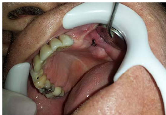
Figura 1 – Aspecto clínico inicial do paciente, evidenciando a comunicação oro-antral.

posterior, perda de continuidade do assoalho do seio maxilar esquerdo (Figura 02-A). Na reconstrução coronal, observou-se espessamento da mucosa sinusal, compatível com sinusopatia inflamatória (Figura 02-B).